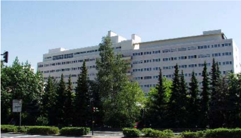
Abbildung: Hochtaunus-Kliniken Standort Bad Homburg

Die Hochtaunus-Kliniken gGmbH vereint die Krankenhäuser Bad Homburg und Usingen unter ihrem Dach. Als akademisches Lehrkrankenhaus der Universitätskliniken Gießen und Frankfurt am Main mit 427 Betten für die akutmedizinische Versorgung ist sie der Schwerpunktversorger im Hochtaunuskreis.